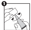
Cortar la aleta

Posología y forma de administración: En el tratamiento de infecciones superficiales se sugiere aplicar aproximadamente 1 cm de longitud del ungüento directamente sobre el ojo infectado hasta 6 veces por día, dependiendo de la severidad del proceso infeccioso a tratar. Para la profilaxis de la oftalmia neonatal gonocócica o por Chlamydia, una línea de aproximadamente 1 cm de longitud debe ser aplicada en cada saco conjuntival. El ungüento no debe fluir fuera del ojo luego de la instilación. Un nuevo tubo debe ser usado por cada niño.