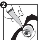
Instilar según prescripción médica

Contraindicaciones: ERITROFARM® está contraindicado en pacientes con hipersensibilidad a la Eritromicina.