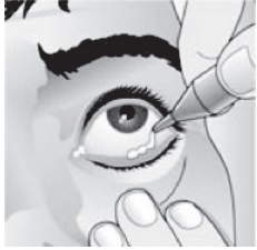
Aplicación de LOTESOFT® ungüento oftálmico en la parte interna del párpado inferior.